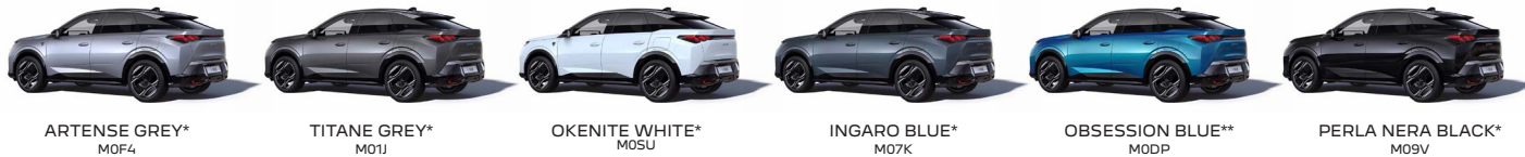
ARTENSE GREY* M0F4